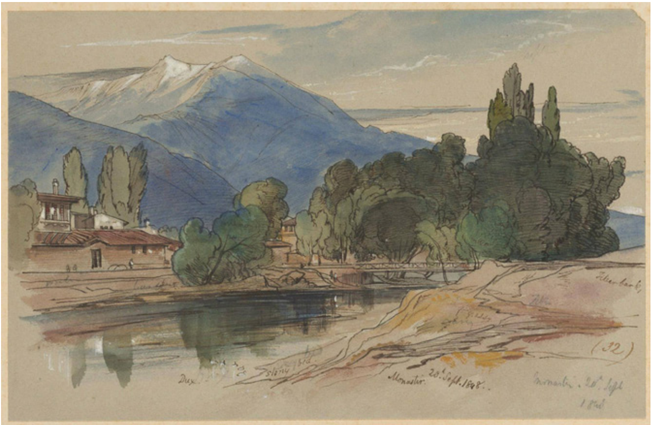
Сл. 3, Едвард Ли'р, панорама на градот, 1848

исламски установи: во 1430 првата библиотека на исламска литература 16 , потоа светите гробови на дервишите Кирхор-баба и Џигер-баба 17 , а по 1491 едно теќе на накшбенди-дервишите, од страна на следбениците на шејх Абдала ал Илахи од Енице-вардар 18 .