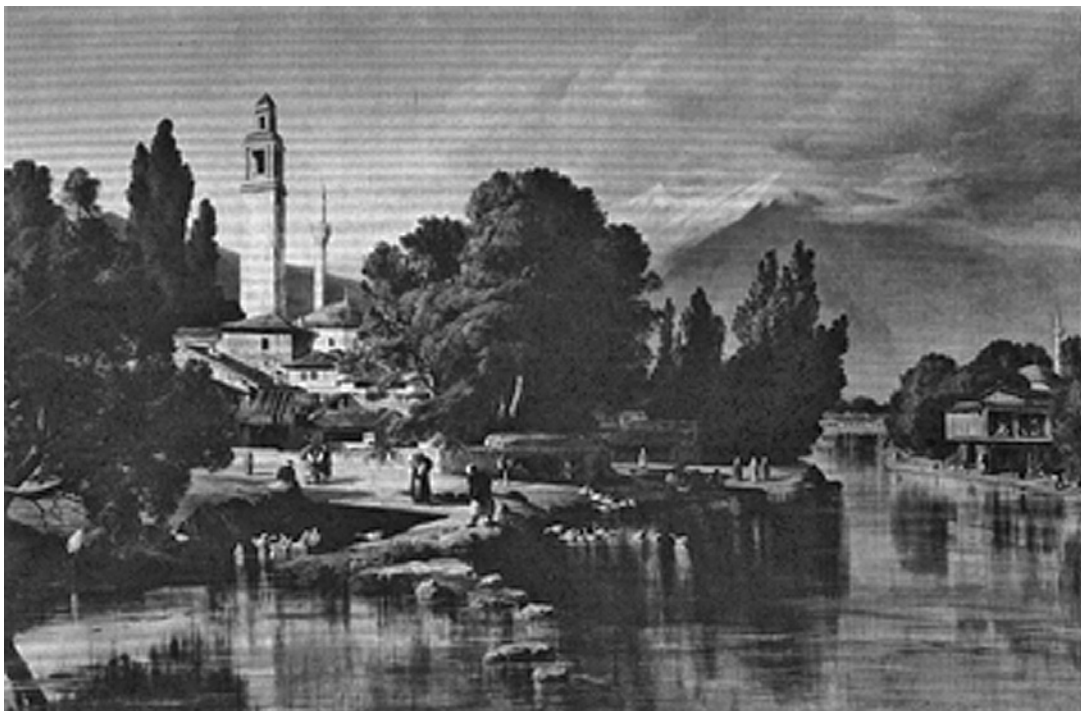
Сл. 2, Едвард Ли'р, панорама на градот, 1848

Албанија во 1466, а Бајазит II во 1492 остана во градот три дена, кога еден непознат хајдари-дериш се обиде да го убие 13 .