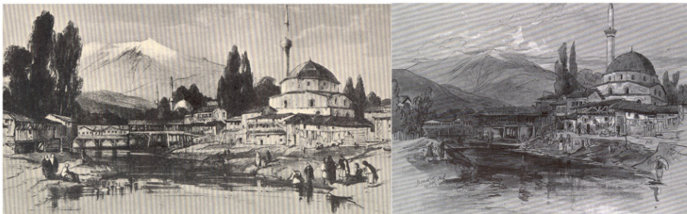
Сл. 4, Едвард Ли'р, панорама на градот, 1848

Пописот на населението во 1521 покажува зголемување од повеќе од 68% на градското население 24 . Врз основа на пописот се проценува дека градот броеше 625 муслимански семејства, 198 христијански семејства, 48 еврејски семејства и 19 цигански семејства. Во тоа време областа на градот беше поделена на 22 муслимански маала, 10 христијански, 1 еврејско (Семаат-и Јехудијан) и 1 циганско (Семаат-и Џинганејан) 25 . На почетокот на шеснаесеттиот век Битола/Манастир беше помеѓу четириесет и петте градови коишто беа хас на султанот со приходи меѓу 100000 и 300000 акчиња 26 .